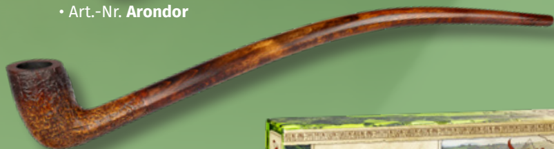
• Art.-Nr. Arondor S