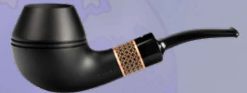
• Art.-Nr. TM 146