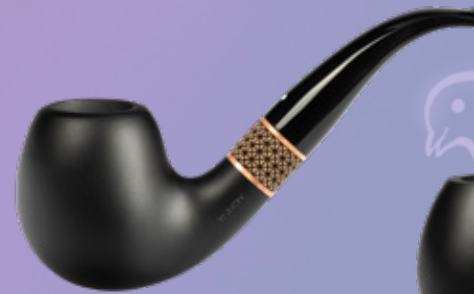
• Art.-Nr. TM 104

Unsere neue Timber – Handwerk und Tradition par excellence vereint