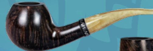
• Art.-Nr. 2244