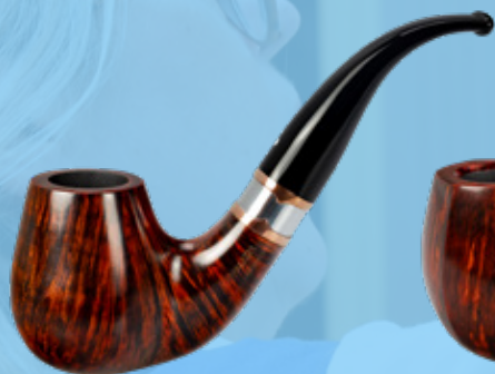
• Art.-Nr. DA 142