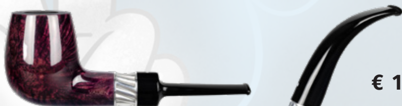
• Art.-Nr. MT 111

Unsere neue Mito – auf geht's zu luftigen Höhen