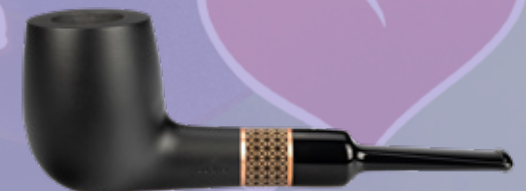
• Art.-Nr. TM 186