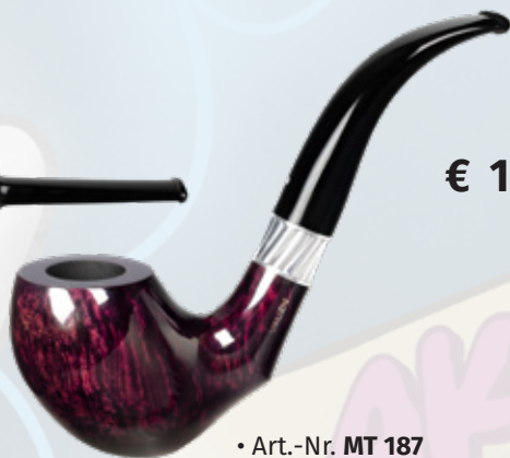
• Art.-Nr. MT 187