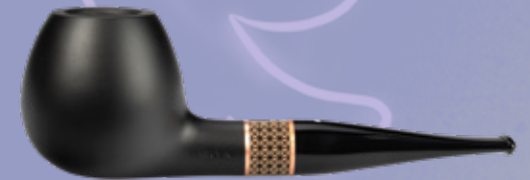
• Art.-Nr. TM 131