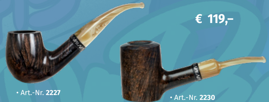
• Art.-Nr. 2227