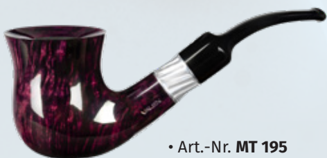
• Art.-Nr. MT 195