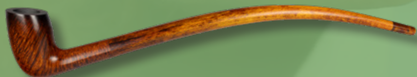
• Art.-Nr. Arondor

Pure Genussfreude – mit unserer eleganten Arondor