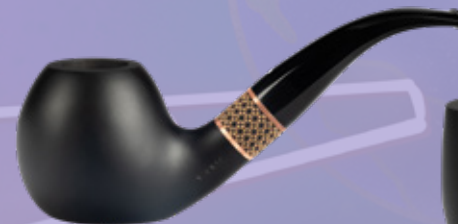
• Art.-Nr. TM 179 Standpfeife