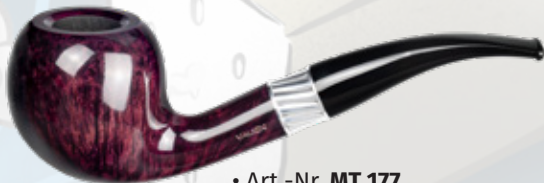
• Art.-Nr. MT 177