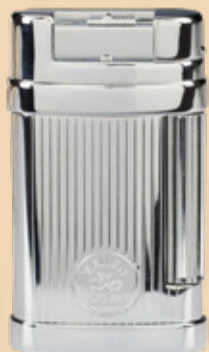
• Art.-Nr. 595