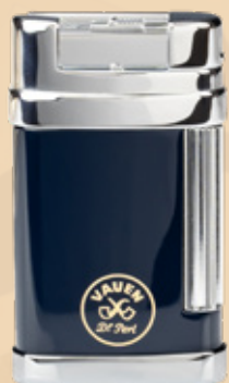
• Art.-Nr. 596