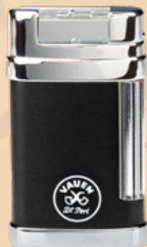
• Art.-Nr. 597