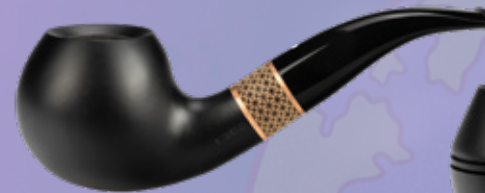
• Art.-Nr. TM 137