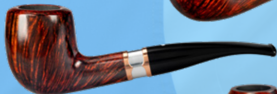
• Art.-Nr. DA 168