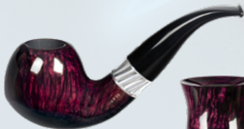
• Art.-Nr. MT 115