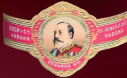
Hier: King Edward VII. (1841-1901), König des vereinigten Königreichs und der britischen Übersee-Territorien und Kaiser von Indien.