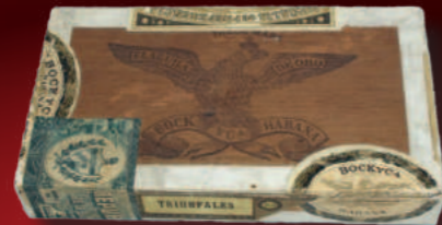
Über die Jahre entwickelte Bock auch verschiedenste Zigarrenkisten.