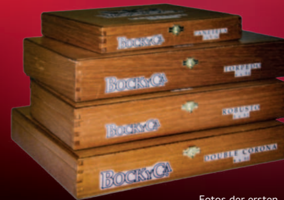
Fotos der ersten Andruckmuster von 1999

Die selbstständige Vertriebsgesellschaft „El Mundo Del Tabaco“ – eine hundertprozentige Tochter der VILLIGER SÖHNE GmbH – brachte als eine der ersten Marken die „neue“ Bock y Ca. auf den Markt.