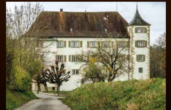
Schloss Neuhaus in der Nähe von Heilbronn