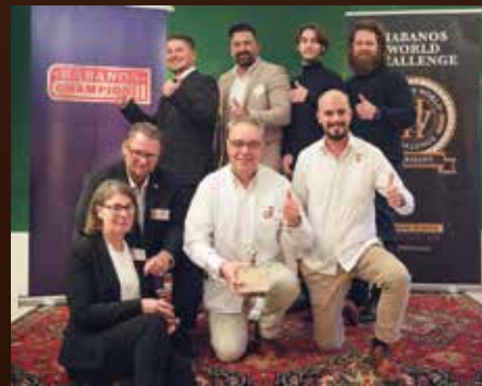
Die vier Teams beim Wettbewerb um den Habanos Champion 2023.

Die meisten Teilnehmer und Gäste reisten schon am Freitagabend an. So konnte man die Atmosphäre des Schlosses entspannt genießen und sich auf den Wettbewerb einstellen. Da blieb sogar für einige noch Zeit für eine Partie Billard vor dem Abendessen, während andere einfach nur ihren Aperitif genossen.